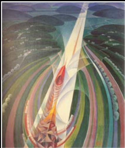
Gerardo Dottori (1884 - 1977) Trittico della Velocità - "La corsa" 1925-27