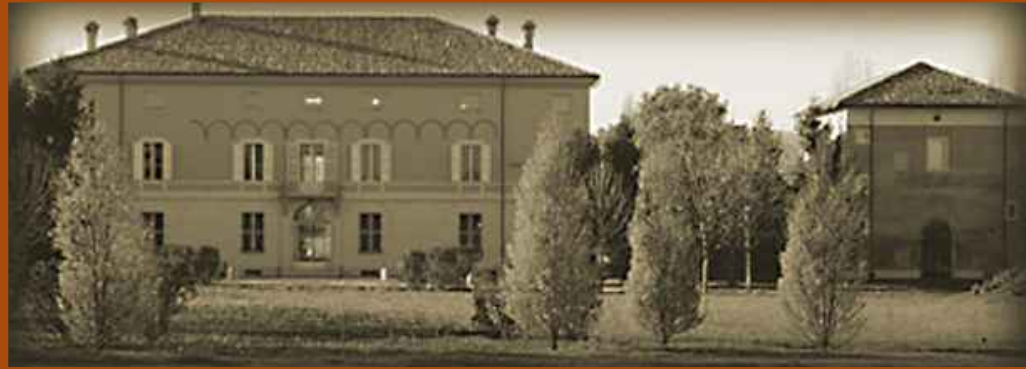
Palazzo Bentivoglio Pepoli Zola Predosa, Bologna